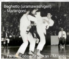
Beghetto (uramawashigeri) - Marangoni