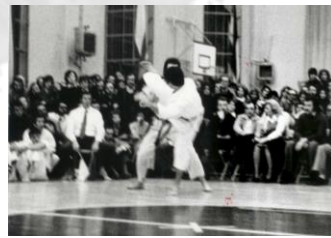
1975 - Coppa Shotokan - Milano